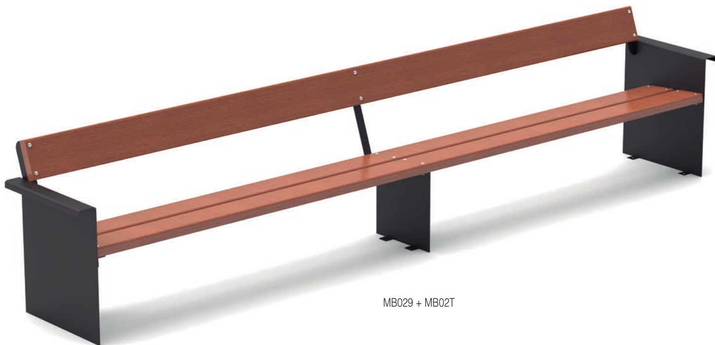
MB029 + MB02T