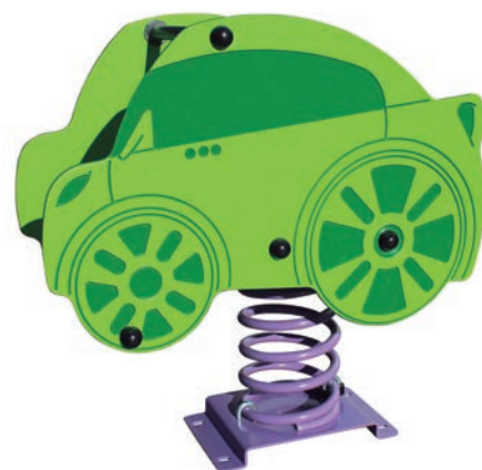
COCHE CAR VOITURE CARRO