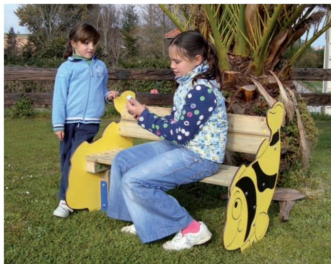
Banco TROPI TROPI bench Banc TROPI Banco TROPI